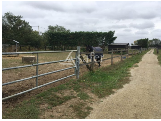
Document non contractuel